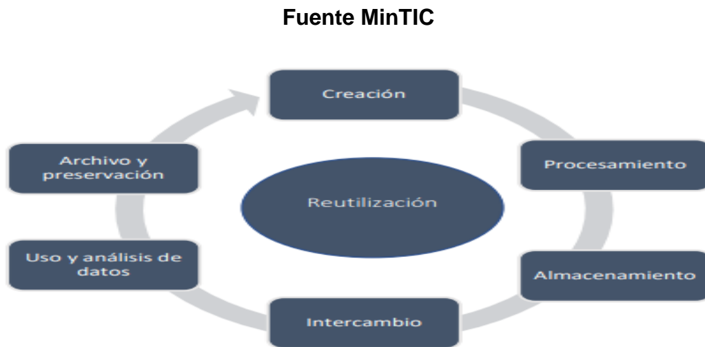
Ilustración 4 Ciclo de vida del dato

La gestión del ciclo de vida del dato es un proceso indispensable para alcanzar el aprovechamiento de los datos dispuestos en Entidad. El ciclo de vida de los datos está integrado por diferentes fases como se muestra a continuación: