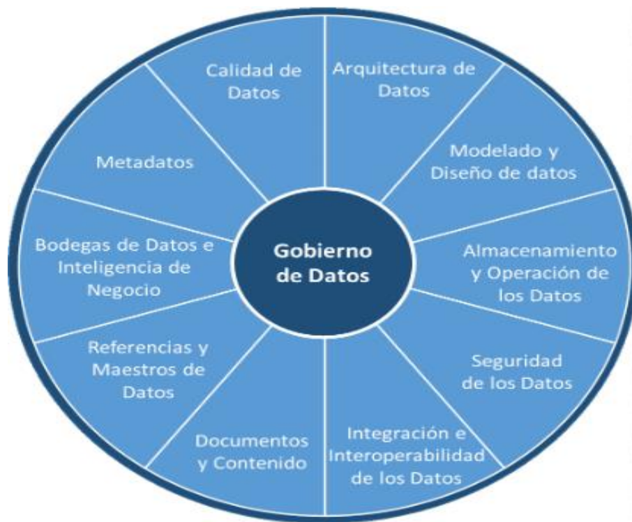
Ilustración 1 Funciones de gestión de datos